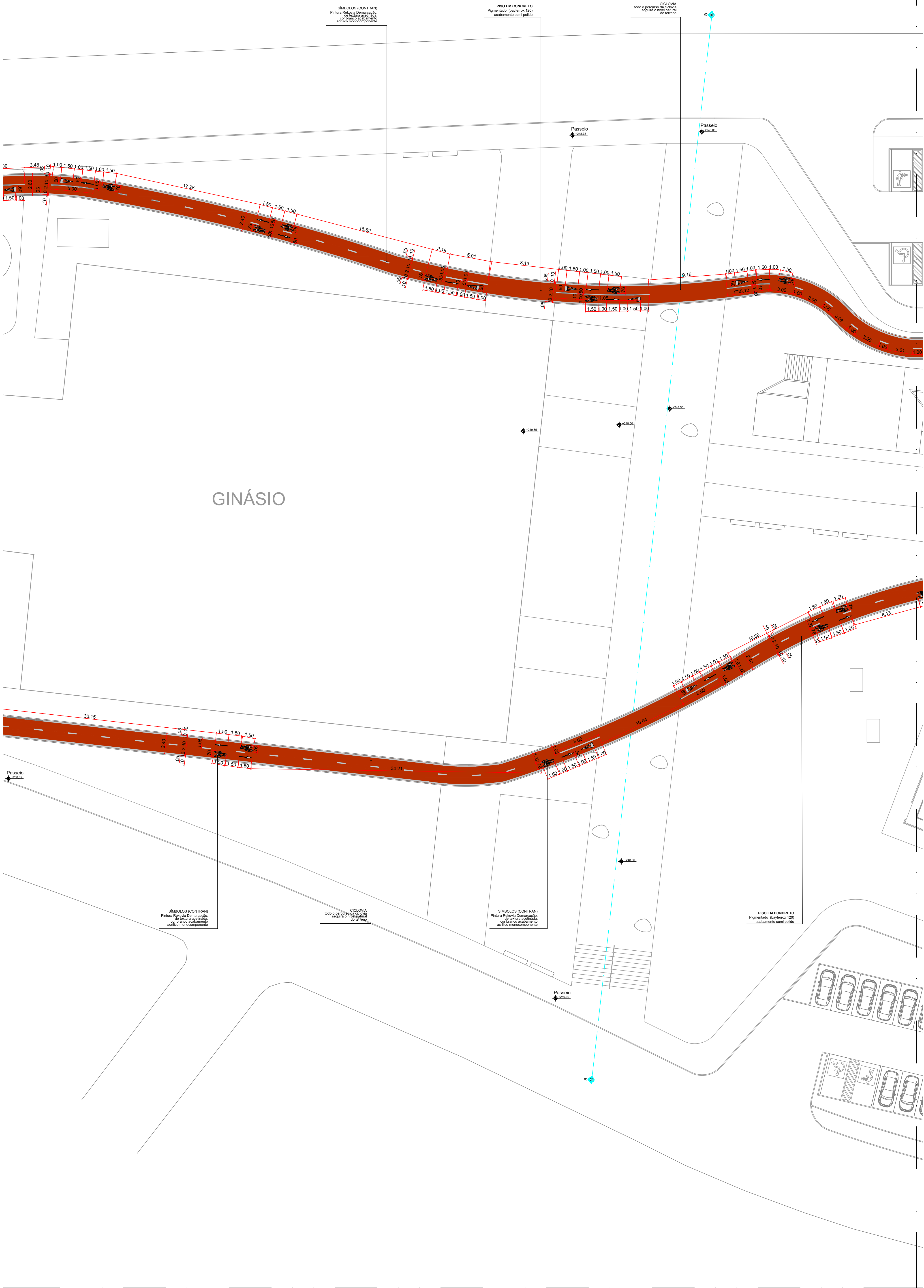
PLANTA BAIXA - TRECHO 2 esc. 1:200